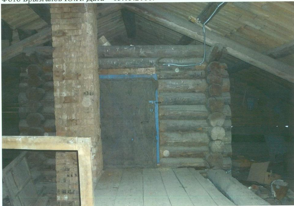
Фото 9. «Дом, в котором родился и прожил юношеские годы Маршал Советского Союза Иван Степанович Конев», Кировская область, д. Лодейно. Дата – 03.03.2016.