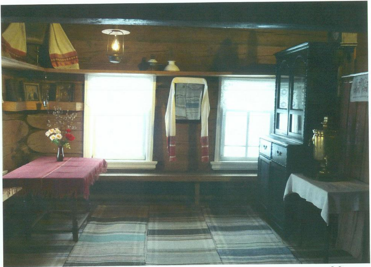
Фото 6. «Дом, в котором родился и прожил юношеские годы Маршал Советского Союза Иван Степанович Конев», Кировская область, д. Лодейно. Дата – 03.03.2016.