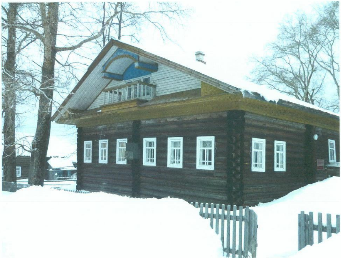
Фото 1. «Дом, в котором родился и прожил юношеские годы Маршал Советского Союза Иван Степанович Конев», Кировская область, д. Лодейно. Дата – 03.03.2016.