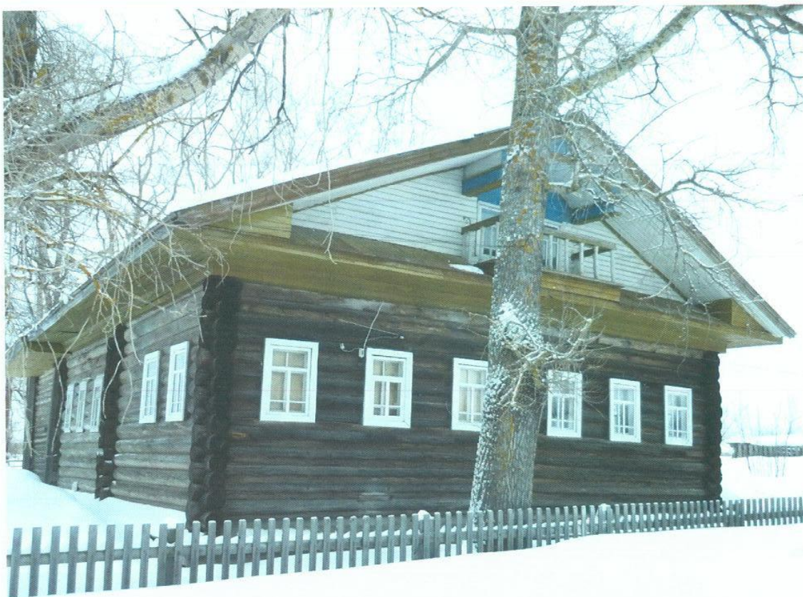
Фото 2. «Дом, в котором родился и прожил юношеские годы Маршал Советского Союза Иван Степанович Конев», Кировская область, д. Лодейно. Дата – 03.03.2016.