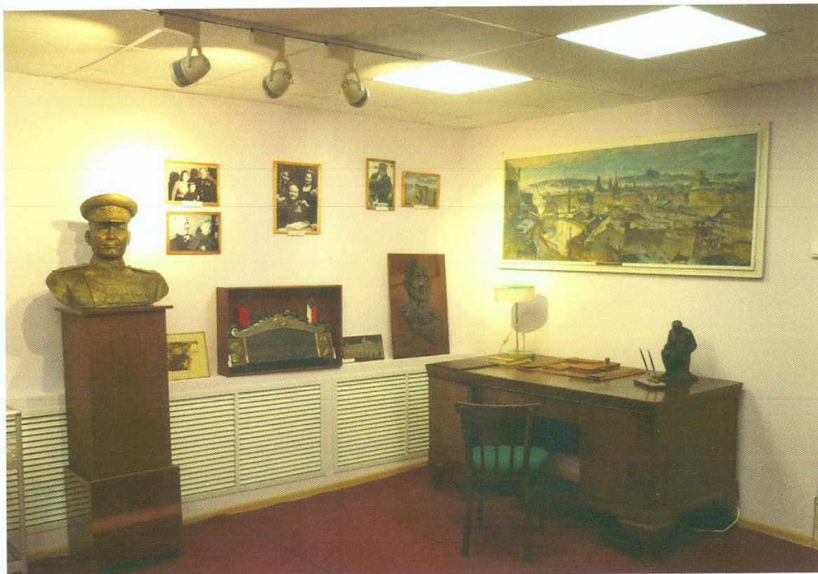
Фото 8. «Дом, в котором родился и прожил юношеские годы Маршал Советского Союза Иван Степанович Конев», Кировская область, д. Лодейно. Дата – 03.03.2016.