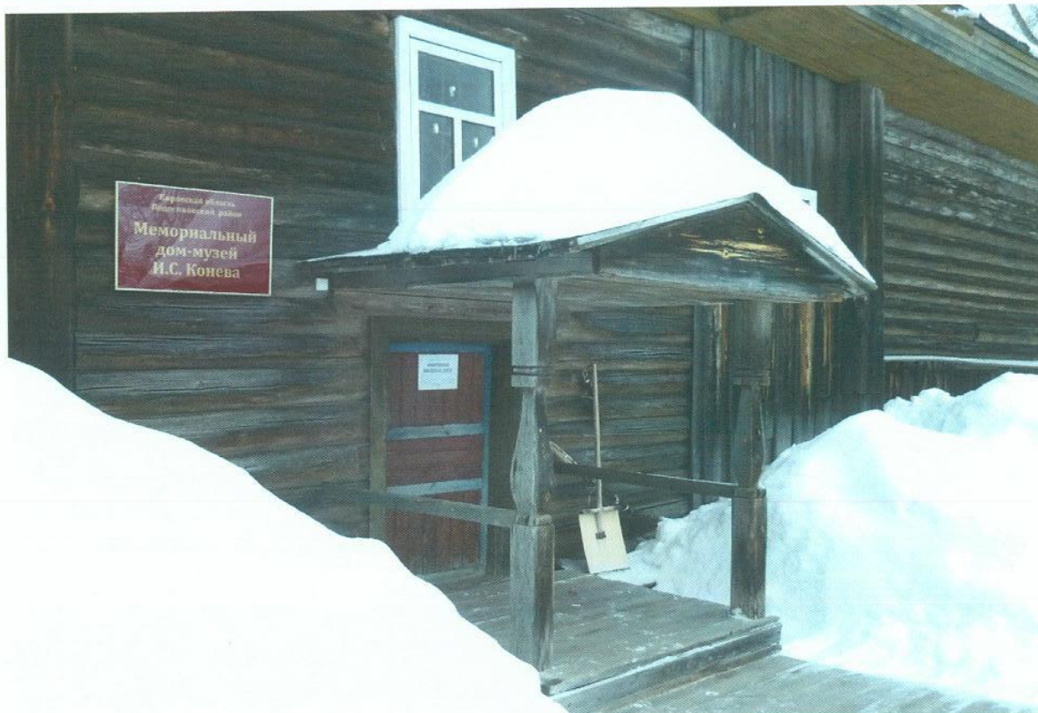
Фото 4. «Дом, в котором родился и прожил юношеские годы Маршал Советского Союза Иван Степанович Конев», Кировская область, д. Лодейно. Дата – 03.03.2016.