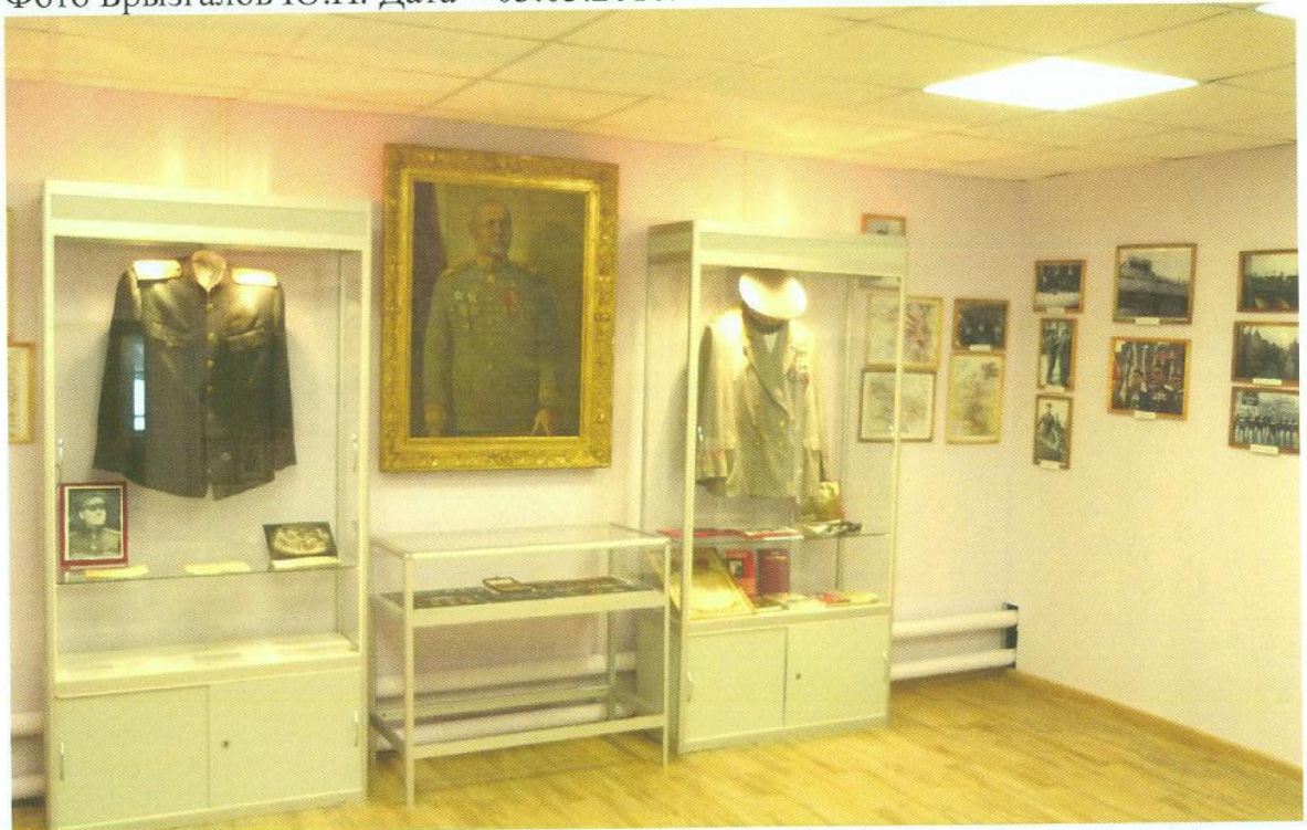
Фото 7. «Дом, в котором родился и прожил юношеские годы Маршал Советского Союза Иван Степанович Конев», Кировская область, д. Лодейно. Дата – 03.03.2016.