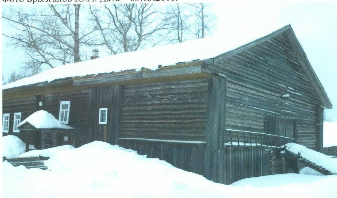
Фото 3. «Дом, в котором родился и прожил юношеские годы Маршал Советского Союза Иван Степанович Конев», Кировская область, д. Лодейно. Дата – 03.03.2016.